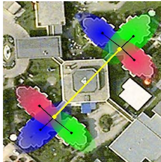
Overzicht van radiodekking

Draadloos internet zonder vragen begint bij een netwerk met een goede radiodekking. Als er op een locatie weinig radiosignaal is en gasten komen met een laptop die het signaal niet zo goed oppikt geeft dit gelijk vragen: waarom werkt het hier niet en daar wel. Een Wandy netwerk geeft dit soort vragen niet. Dit komt omdat de hoogste kwaliteit radio's voor een sterk signaal en gevoelige ontvangst zorgen.